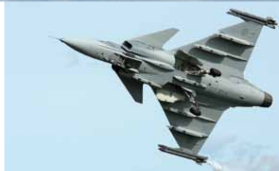
Saab JAS-39 Gripen AB, aktuelles Modell.