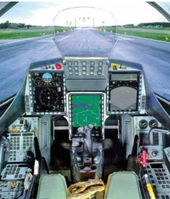
Der neue Gripen für die Schweiz würde stark modernisiert (MS21).

schieden, von der es derzeit noch keinen flugfähigen Prototypen gibt. JAS steht für „Jakt, Attack och Spaning“, das heisst Jagd, Angriff und Aufklärung. Gegenüber dem aktuellen Gripen C/D besitzt die Version MS21 ein deutlich stärkeres Triebwerk . Mit dem General Electric F414G Mantelstromtriebwerk erhält der Gripen nun die Fähigkeit, Überschallgeschwindigkeit ohne dem Einsatz des Nachbrenners zu erreichen und zu halten (Supercruise). Dieses Triebwerk ist zudem identisch mit dem des F/A-18. Somit ist bei der Wartung das Know how bereits vorhanden. Die neue