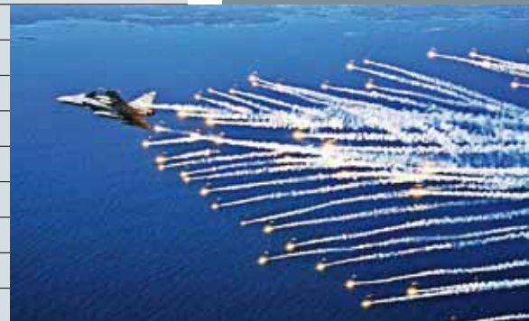
Wirksame Luft-Luft- und Boden-Luft-Lenkaffen-Abwehr (Flares)